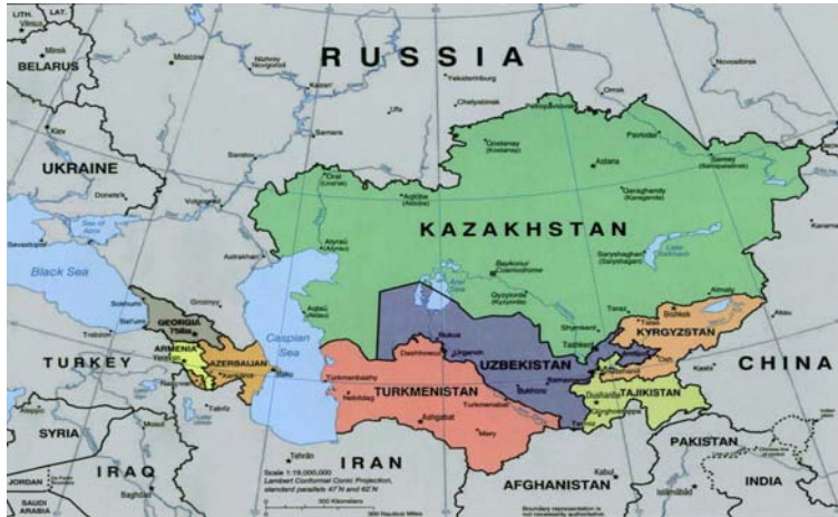
منبع: احمدی پور و دیگران، ۱۳۸۹، ص ۶۵