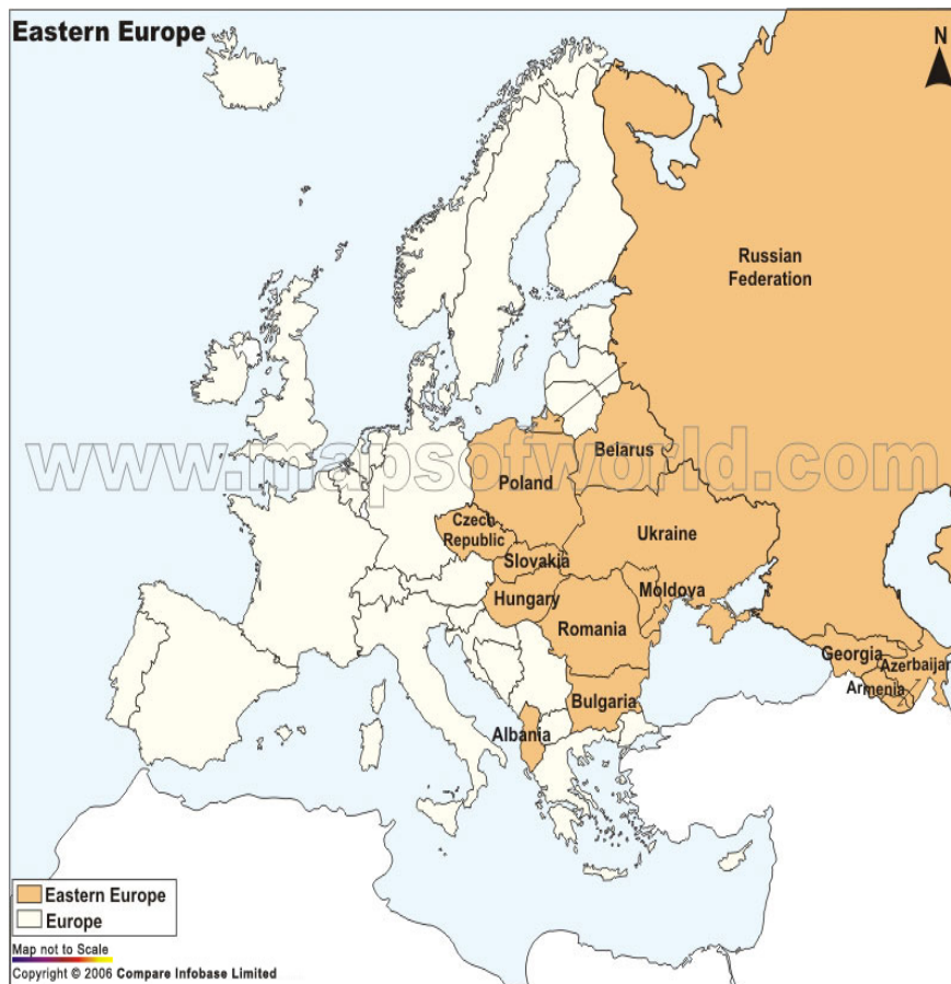
نقشه شماره ۱: نقشه سیاسی اروپای شرقی