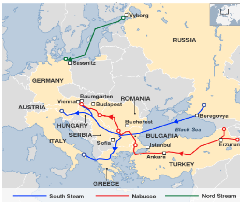
نقشه مسیر خطوط لوله نابوکو، جریان شمالی و جریان جنوبی

۱. تأمین امنیت و متنوع‌سازی مسیرهای انتقال انرژی: اگر چه طرح مورد علاقه اروپا کشیدن خط لوله نابوکو و استفاده از منابع گاز ترکمنستان، ایران و آذربایجان است، اما روسیه مدعی است که می‌تواند هدف‌های «سیاست متنوع ساختن منابع تأمین انرژی اروپا» را از راه متنوع ساختن خطوط لوله انتقال گاز و همچنین متنوع ساختن مسیرهای انتقال گاز به قاره قدیم تأمین کند (بهمن، ۱۳۹۰، صص ۱۶-۱۷).