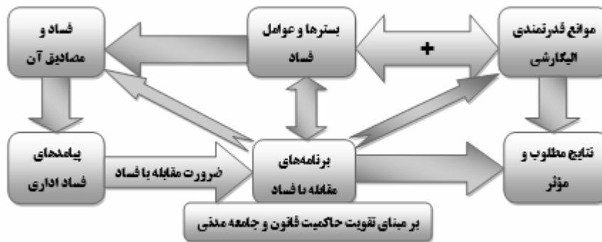
شکل ۲. مدل پیشنهادی - راهبرد جامع و فراسیستماتیک