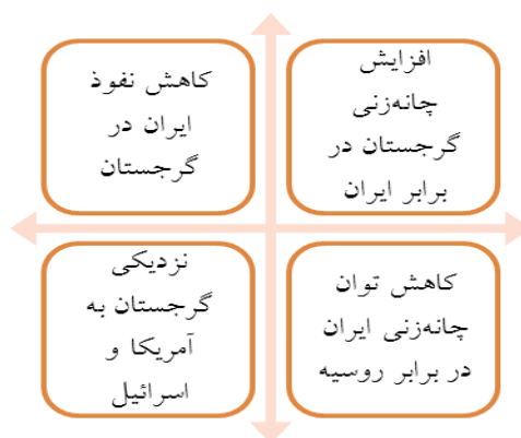
شکل ۱. تأثیر منفی کاهش همکاری با اتحادیه اروپا در گرجستان برای ایران

باید توجه داشته باشیم که نبود همکاری میان ایران و اتحادیه اروپا در زمینه‌های مختلف، به‌شکل بالقوه می‌تواند روی توانایی و روابط ایران در ارتباط با این منطقه تأثیرهای منفی زیادی برجای گذارد. مهم‌ترین این تأثیرها در شکل ۱ نشان داده شده است.