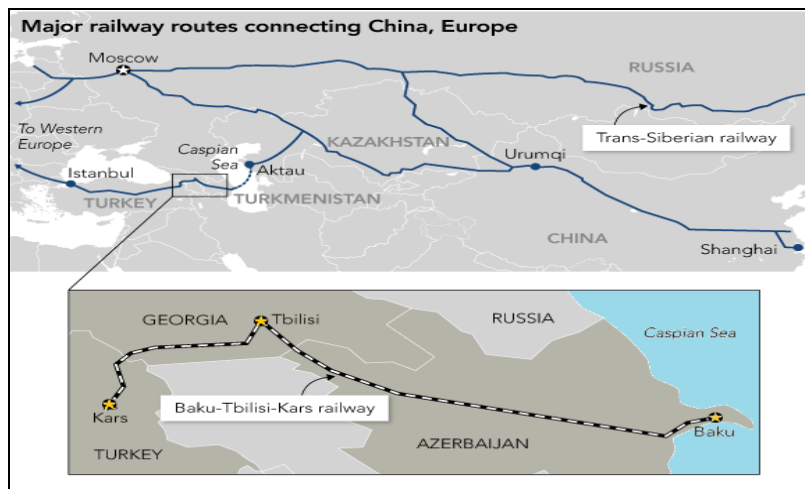
نقشه ۴. موقعیت ریلی چین و خط آهن باکو، تفلیس و قارص