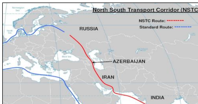
نقشه ۲. مسیر حمل و نقل شمال - جنوب

در چین ۱ است (Azertac, 2019; Huseynov, 2018: 84). بعد از افتتاح راه آهن باکو، تفلیس و قارص (نقشه ۴) در ژوئن ۲۰۱۷ اهمیت مسیر حمل و نقل آذربایجان برای چین دوچندان شده است. در این زمینه شاهین مصطفی یف، ۲ وزیر اقتصاد آذربایجان اعلام کرد که انتظار می رود از این پس ۱۰ تا ۱۵ درصد صادرات کالاهای چینی به اروپا از این مسیر عبور کند (Huseynov, 2018: 84). جمهوری آذربایجان می کوشد میان قدرت های حاضر در قفقاز جنوبی موازنه ایجاد کند. از این رو، نه در تنها در محور شرقی - غربی و مسیرهای انتقالی آن مشارکت دارد، بلکه خواستار همکاری نزدیک با ایران و روسیه برای ساخت راهروی بین المللی شمالی - جنوبی است (Poghosyan, 2018: 3). این رویکرد جمهوری آذربایجان با نگاه خوشه ای چین به قفقاز جنوبی هماهنگ است. در این زمینه رؤسای جمهور ایران، روسیه و جمهوری آذربایجان در باکو در سال ۲۰۱۶ برای اتصال خطوط ریلی سه کشور در قالب این طرح به توافق رسیدند (Ismailzade, 2016). نقشه ۲ این مسیر را نشان می دهد.