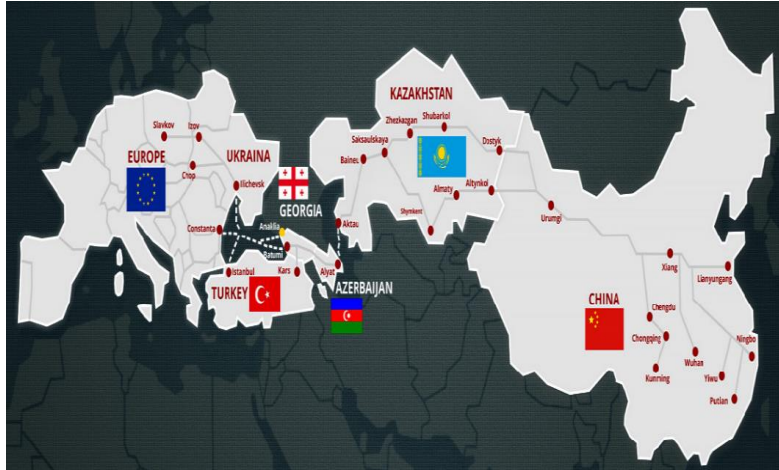
نقشه ۳. جاده مسیر حمل و نقل بین‌المللی و راجزر