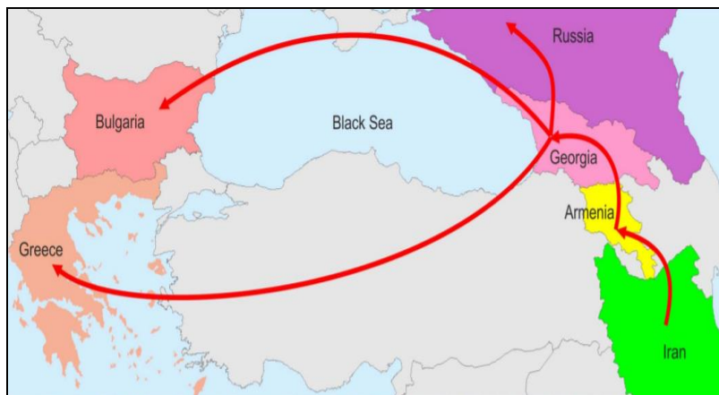
نقشه ۵. راهروی خلیج فارس و دریای سیاه

از دیگر مسیرهای انتقالی قفقاز جنوبی که مکمل رویکرد خوشه‌ای چین در منطقه است راهروی حمل‌ونقل چندوجهی خلیج فارس و دریای سیاه است که خلیج فارس را از راه ایران، ارمنستان، گرجستان و دریای سیاه به بلغارستان و یونان در اروپا متصل می‌کند. گفت‌وگوهای مربوط به این طرح از سال ۲۰۱۶ آغاز شده است. با توجه به اهمیت ایران در طرح کمربند راه، این طرح می‌تواند سبب اتصال ارمنستان به ابتکار کمربند راه از مسیر ایران (Poghosyan, 2018: 3) و کاهش انزوای ایروان شود. البته این مسیر نیز عملیاتی نشده است. نقشه ۵ نمایانگر این راهرو است.