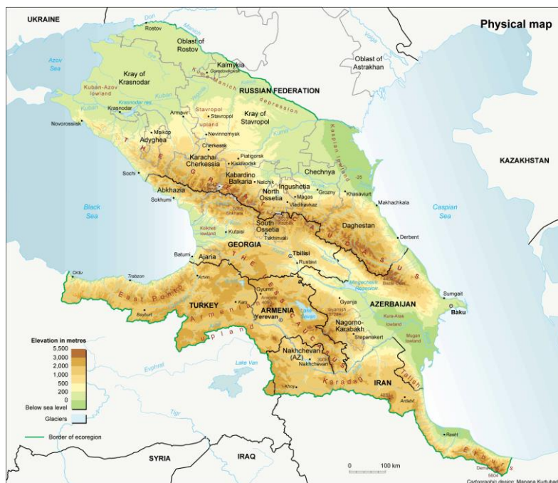
نقشه ۱. قفقاز جنوبی

مناطق آرام و خفته ژئوپلیتیک به شمار می‌آمد، اینک با کشف منابع انرژی فعال‌شده و کشورهای آن به تدریج از انزوای جغرافیایی خارج شده و در پی ایفای نقشی مناسب در عرصه منطقه‌ای و بین‌المللی هستند (Bekiarova, 2019: 1017).