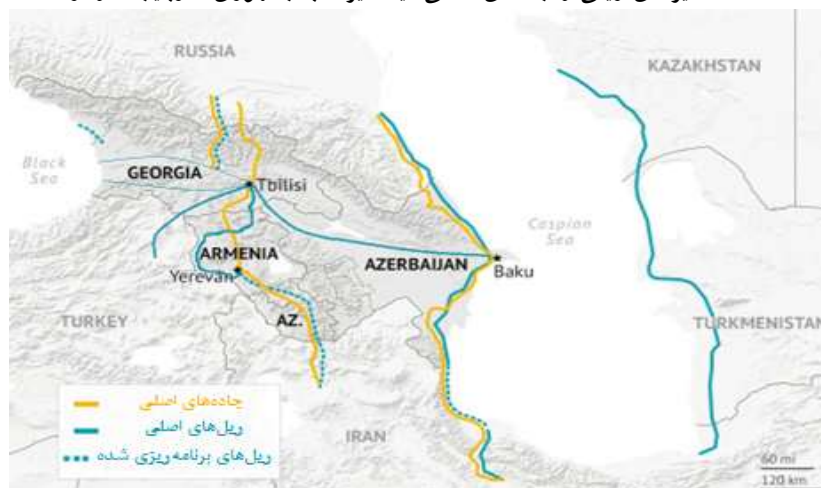
نقشه ۳: مسیرهای ریلی و جاده‌ای اصلی میان ایران با جمهوری آذربایجان و ارمنستان

از سوی دیگر، ارمنستان با روسیه مرز مشترک ندارد و به دلیل اختلاف‌های مسکو و تفلیس دشواری‌هایی برای اتصال این راه‌گذر به روسیه وجود دارد. برخی تحلیلگران این محدودیت‌ها را بدین معنا تفسیر کرده‌اند که تهران مسیر جمهوری آذربایجان را به ارمنستان در راه‌گذر شمال- جنوب ترجیح داده است (Dolaberidze, 2018). در حالی که به نظر می‌رسد انتخاب‌های تهران در این دوره زمانی بیش از اینکه سیاسی باشد اقتصادی بوده است و بر مبنای فرصت‌های اقتصادی موجود تنظیم شده است. شایان توجه اینکه جمهوری آذربایجان علاوه بر اینکه در مسیر راه‌گذر شمالی- جنوبی قرار دارد؛ در چارچوب برنامه تراسیکا بخشی از راه‌گذر جنوبی- غربی نیز محسوب می‌شود (TRACECA, 2021b). یعنی با اتصال شبکه ریلی ایران و جمهوری آذربایجان، علاوه بر دسترسی به روسیه، دسترسی به بندرهای پوتی و باتومی گرجستان به وسیله راه آهن باکو- تفلیس نیز فراهم می‌شود. البته ارمنستان نیز به طور بالقوه می‌تواند ایران را به این بندرها وصل کند. نقشه ۳ این مسیرها را نشان می‌دهد.