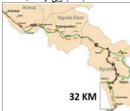
نقشه ۱: جاده جنوبی ارمنستان