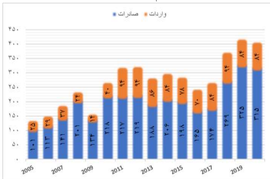
نمودار ۱: حجم صادرات و واردات ایران به/ از ارمنستان