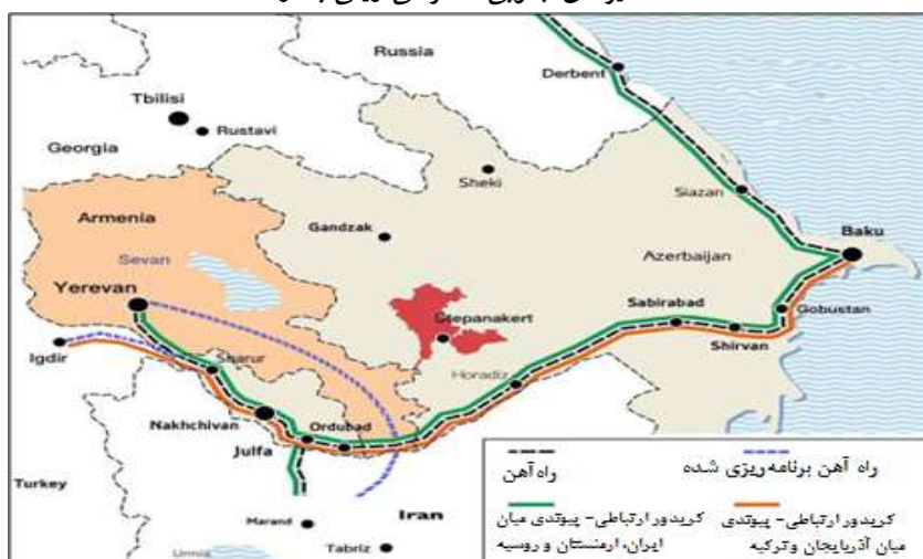
نقشه ۲: مسیرهای جنوبی دسترسی ریلی به ارمنستان

افزون بر مسیر جاده‌ای، خطوط ریلی ارمنستان در بخش‌های شمالی این کشور به گرجستان وصل شده است، اما در بخش‌های جنوبی خط ریلی وجود ندارد. البته یک خط ریلی میان جمهوری آذربایجان و نخجوان وجود دارد که در زمان اتحاد شوروی ساخته شده است. این خط آهن با عبور از استان سیونیک ارمنستان (۴۳،۴ کیلومتر) به نخجوان و سپس به ایروان می‌رسد. ایران با راه‌آهن جلفا به این مسیر ریلی متصل است و از این راه به ارمنستان دسترسی ریلی دارد. اما بعد از جنگ اول قره‌باغ در سال ۱۹۹۴ این خط آهن از سوی جمهوری آذربایجان و ترکیه بسته شد (Huseynov, 2021). نقشه ۲ مسیر ریلی اشاره‌شده و راه‌گذرهای احتمالی پس از جنگ دوم قره‌باغ در سال ۲۰۲۰ را نشان می‌دهد.